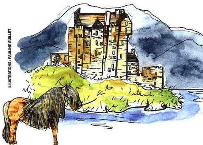
ILLUSTRATIONS : PAULINE GUILLET

AU SON DE LA CORNEMUSE... Chaque été, près de 1000 musiciens, joueurs de cornemuse, tambours, chanteurs et danseurs, dans leurs apparats militaires, se produisent sur l'esplanade du château d'Édimbourg. The Royal Edinburgh Military Tattoo.